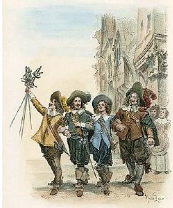
Athos, Porthos, Aramis et d'Artagnan bras dessus, bras dessous, après avoir croisé le fer avec les gardes du cardinal au couvent des Carmes déchaux. Gravure de Jules Huyot d'après un dessin de Maurice Leloir pour une réédition du roman (Paris, Calmann-Lévy, 1894)